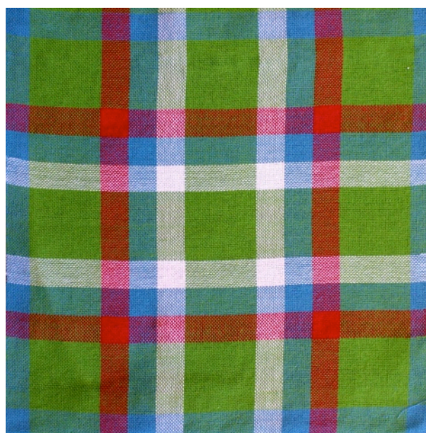
Marion's ruit geweven tijdens basis weven 2.

De kosten van een cursus kunnen voor sommigen mensen een serieuze hindernis zijn om deel te nemen. Er zijn verschillende mogelijkheden om deze barrière te slechten. Contact opnemen met Mirja en overleggen zal de problemen meestal oplossen.