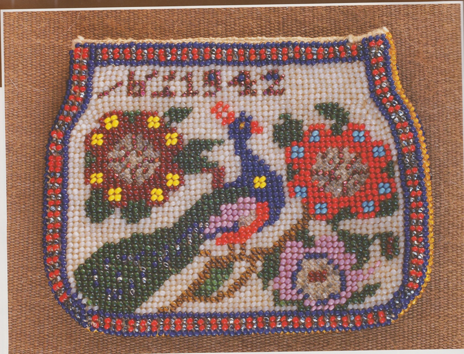
Kralenbeursje met leren binnenwerk. Gemaakt in de gevangenis en gedateerd '1942' met het woord tadakhar (herinnering) er ingehaakt.

Hij begint een nieuw project met het aanrijgen van alle kraaltjes in de goede volgorde. De lange sliert windt hij om een opgerolde krant. Dan begint hij met het laatst aangeregen kraaltje en haakt een werk met vasten. Na het insteken van de naald schuift hij een kraaltje naar het haakwerk toe. Dan maakt hij de steek af. Het resultaat is stijf en hard en heeft geen elasticiteit omdat het bedoeld is als basis voor een vaasje.