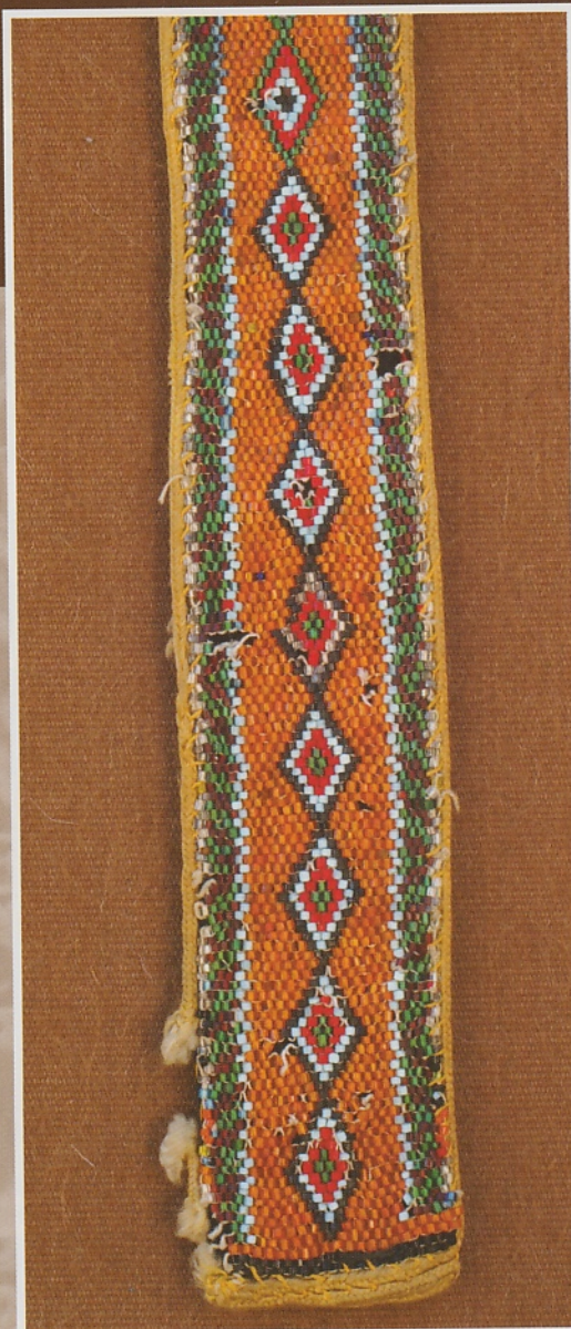
Kralenceintuur zoals die op feesten wordt gedragen door Druzenvrouwen.