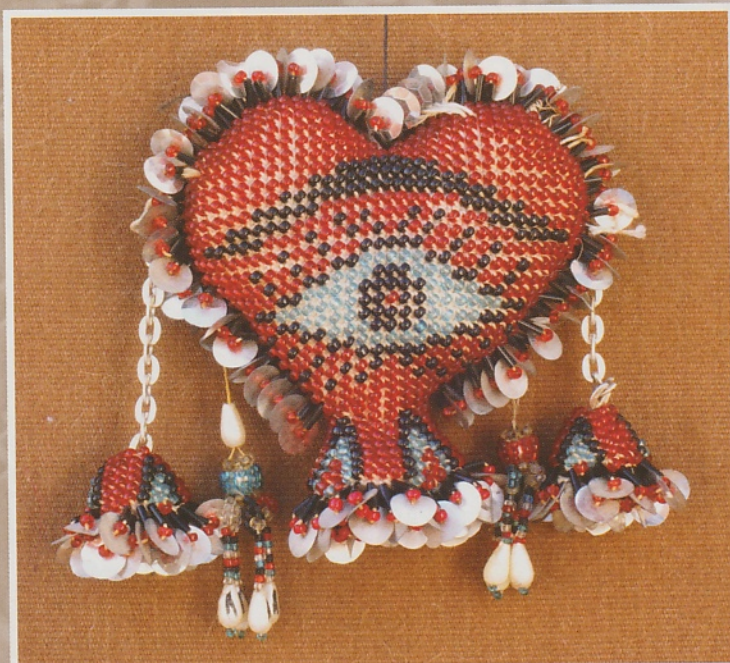
Gehaakt hart met het beschermende blauwe oog erop. De verhouding garen en kraal laat veel haakgaren in het zicht. Haken in vorm met meerderen en minderen.