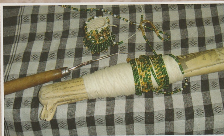
De haaknaald, de aangeregen kraaltjes rond de krant gewonden en het nieuwe werkstuk, de basis van een vaasje.