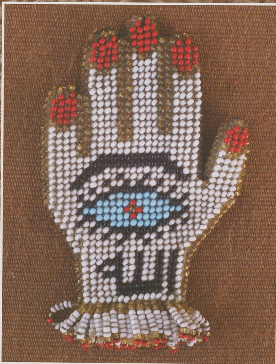
Amulet om het boze oog af te weren.