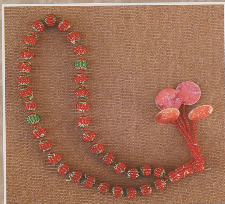
Gebedskettinkje met kralenkoordjes gespannen rond een interne kraal.