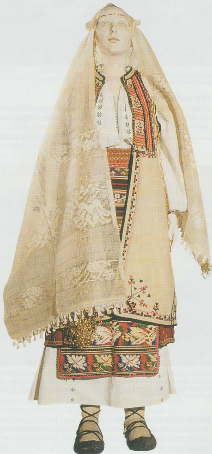
Feestelijk folklore kostuum, Oltenië, begin 20ste eeuw.