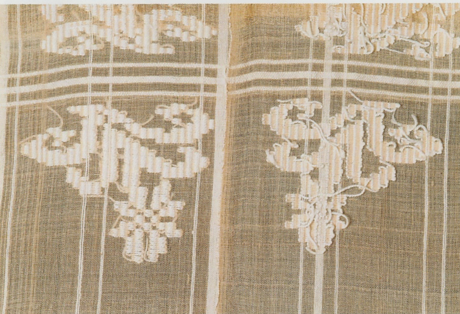
Sjaal in licht oranje hennep met een inlegdraad van dikke witte katoen. Deze techniek heet inlegwerk met verticale bindlijnen. Ook deze sjaal werd met de achterkant boven geweven. De patroondraad gaat onder vier kettingdraden en daarna over twee. Bij deze techniek is een selectielat nodig die breder is dan het weefsel en een spitse punt heeft.