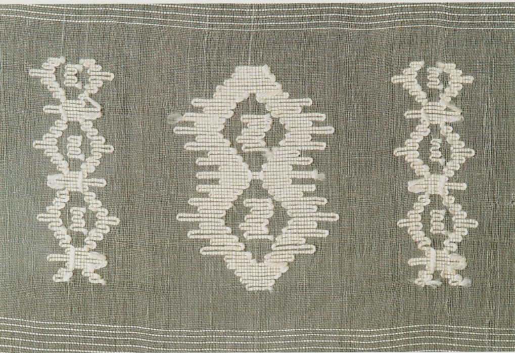
Volledig transparante sjaal in zijde met plaatselijk inlegwerk in de linnenbinding.