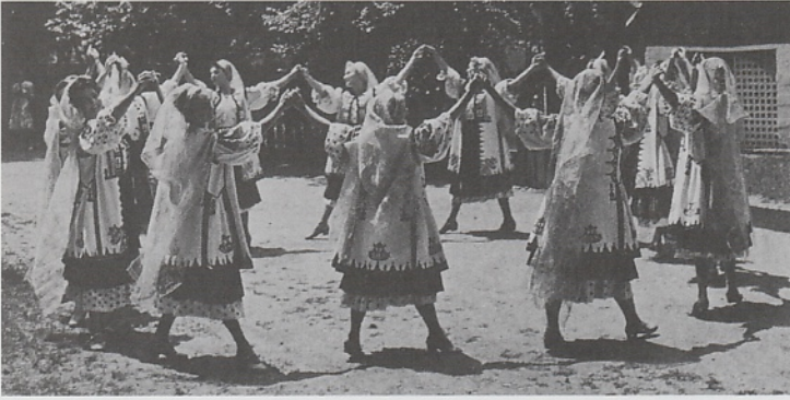
Dansende vrouwen uit Oltenië. Foto uit het boekje 'Village Arts of Roemenia' uit 1971. Uitgegeven door 'Het Comité voor Culturele Relaties met het Buitenland' te Boekarest.