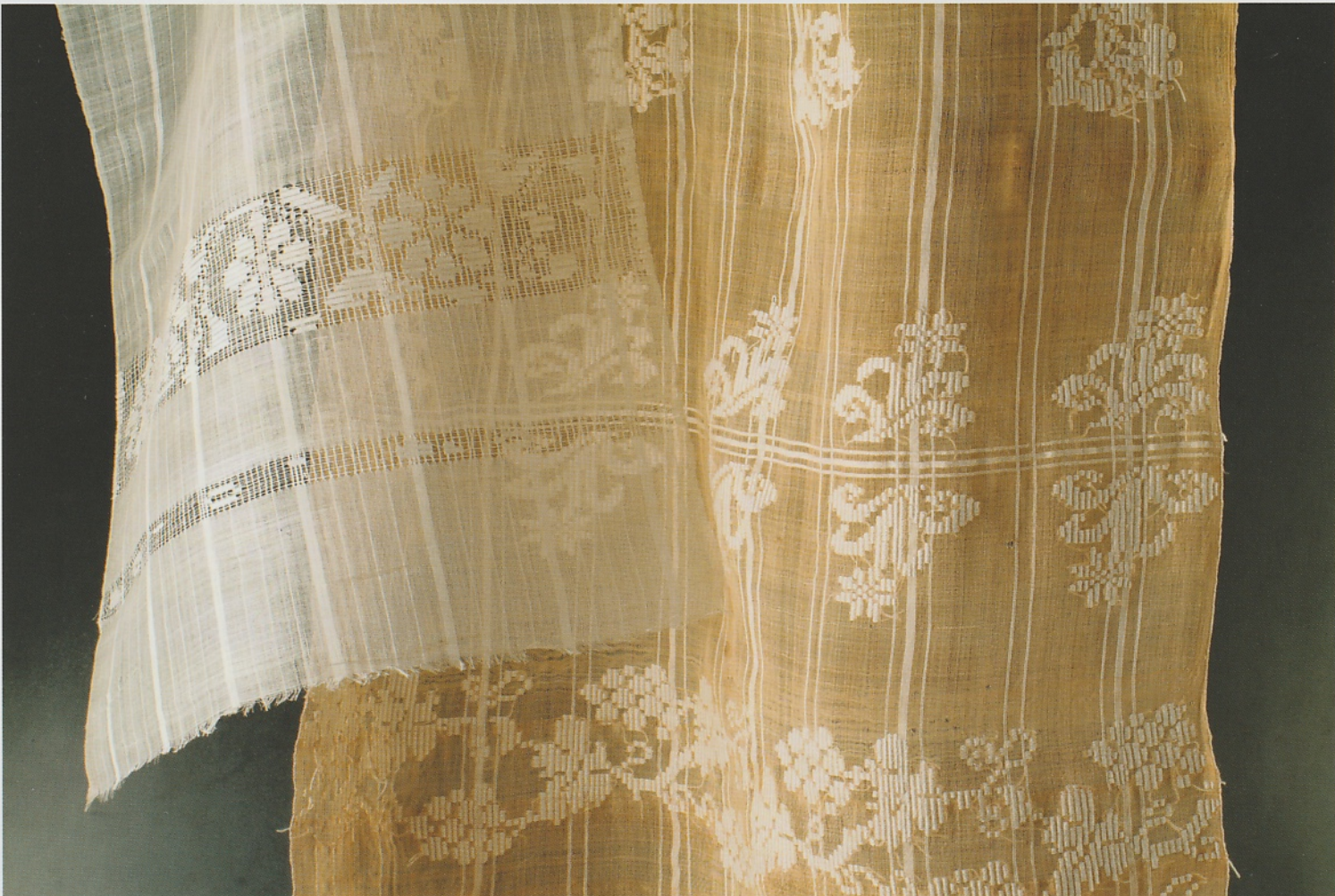
Onder een oranje hennep doek van Gilfa Alexandra gedecoreerd met motieven en ingelegd met verticale bindlijnen. Daarboven een wit zijden doek van Riucănescu waarbij aan de uiteinden patronen ingelegd zijn in linnenbinding op een grond van leno-kant.

In een oud boekje over Roemeense volkskunst vond ik een foto met een kring dansende Olteense vrouwen. Het is feest en elke vrouw heeft haar zijden marama op. Duidelijk is te zien dat de sjaals op het hoofd vastgemaakt zijn aan een soort haarband. Deze band gaat over het midden van het hoofd en laat de haren op het