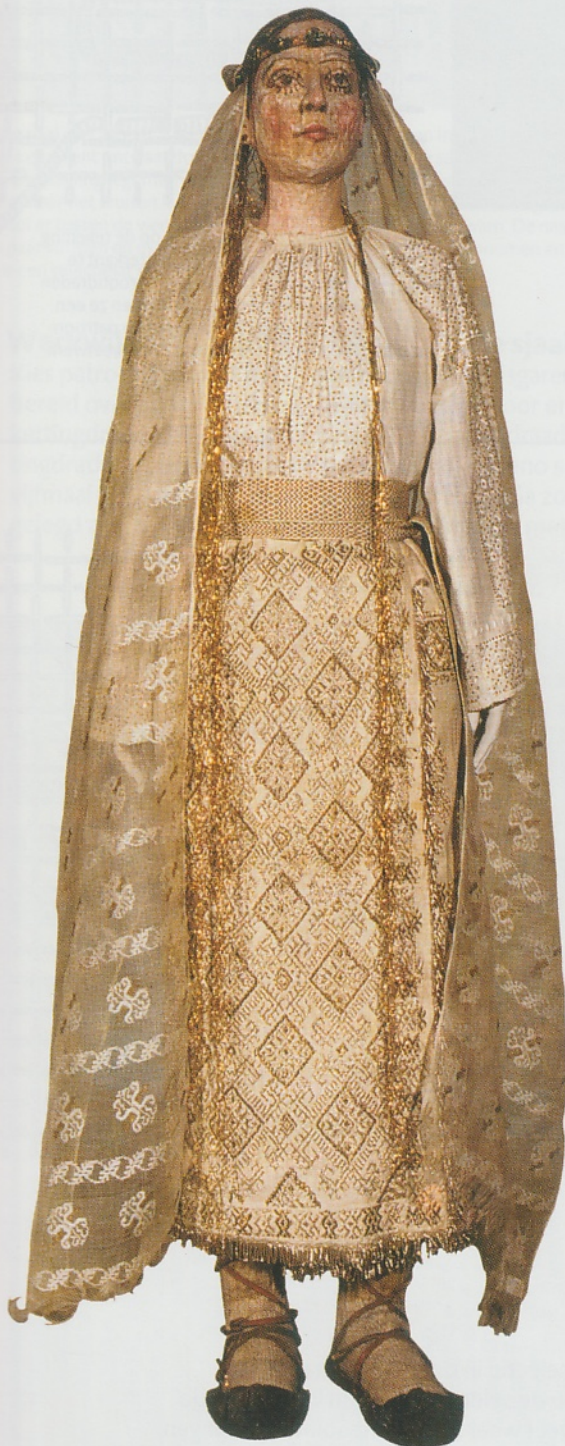
Folklore kostuum voor een bruid, Walachije, begin van de 20ste eeuw.

Alle sjaals zijn gemaakt met dichtheden die variëren tussen de 20 en 25 draden per cm. Dat is weliswaar erg fijn maar wel te doen. In de ketting is de dichtheid wat minder dan in de inslag. Kies een mooi en sterk dun garen uit. Het zal voor zowel de ketting als de inslag gebruikt worden. Maak een ketting en zet hem op het getouw zodat een linnenbinding geweven kan worden. Dat is de basis van alle sjaals. Maak een ontwerp om in te leggen of beslis uit de vrije hand te werken. Ter illustratie heb ik een eenvoudig kruisje als ontwerp gekozen en dat voor alle technieken uitgewerkt in een werktekening. Kies een patroondraad uit om het motief mee in te leggen. Deze moet dikker zijn en liefst glanzender dan het basisgaren.