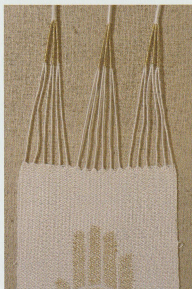
Patroon en afwerking

Wat je moet weten: Je weeft deze sjaal met de onderkant boven. Het patroon komt dus aan de onderzijde van je weefsel. Houd een spiegeltje bij de hand.