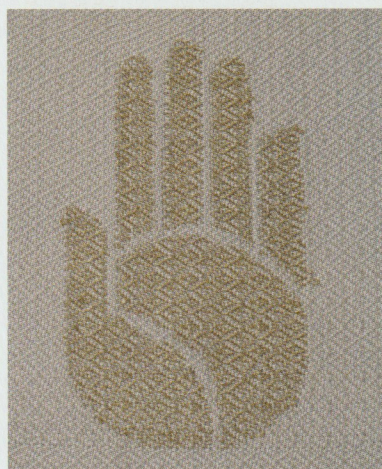
Patroon ingelegd hand goede kant